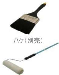
ローラーセット(別売)