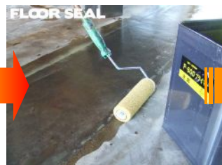
アタッチプライマーを 全面にローラーで塗布