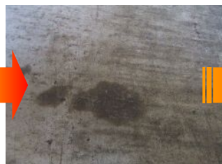
油が染み込んでいます 表面はワイヤーブラシ等で 出来るだけ除去してください。