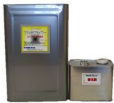
アタッチプライマー 13.5kg