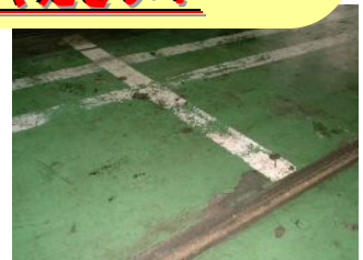
自動車整備工場 塗装表面に油分がある場合