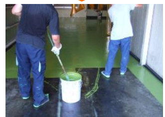
アタッチプライマー硬化後、 HQタイプを塗布してください