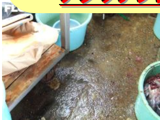
生鮮工場 下地に水分がある場合

下地コンクリートが下記のような場合には アタッチプライマーを使用してから塗装・補修をしてください！