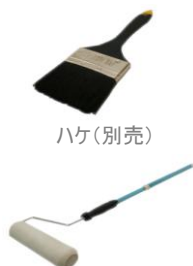
ローラーセット(別売)