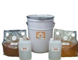
画像はフロアーシールS 18リットルセット (9ℓ×2)