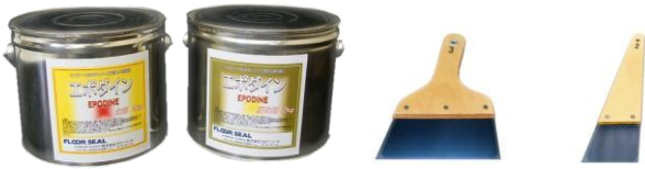
画像はクラックケア 4kg