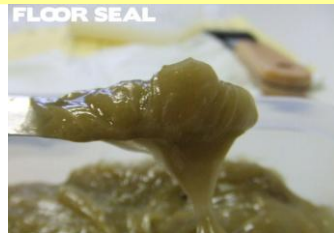
グリス状エポキシ樹脂