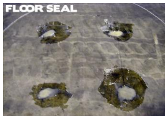
機械やラックを撤去した後の アンカー跡の補修