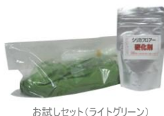
お試しセット(ライトグリーン)

【お試しセット】 初めの方はお試しセットをご使用下さい。 価格 3,240 円(税込) 送料 648 円(税込) ※製品購入合計金額 5,400 円(税込) 以上で送料無料 施工可能面積 約 50 ㎡ セット内容 主剤・硬化剤・取扱説明書・ビニール手袋 まずは、お試しセットでシリカフロアーの強度・接着力を是非一度、体験してみてください。 選べるカラーは全 10 色