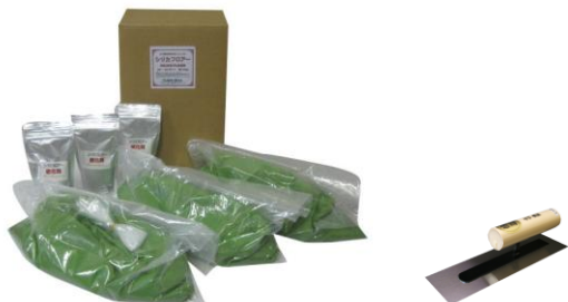
画像は 14.7kg セット(4.9kg×3) 色:ライトグリーン