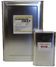
画像はウェアハウスコート 16kg