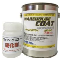
ウェアハウスコート お試しセット