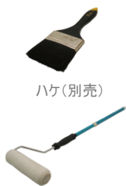
ハケ(別売) ローラーセット(別売)