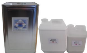
画像はウォーキングコート 20kg 専用プライマー 6kg